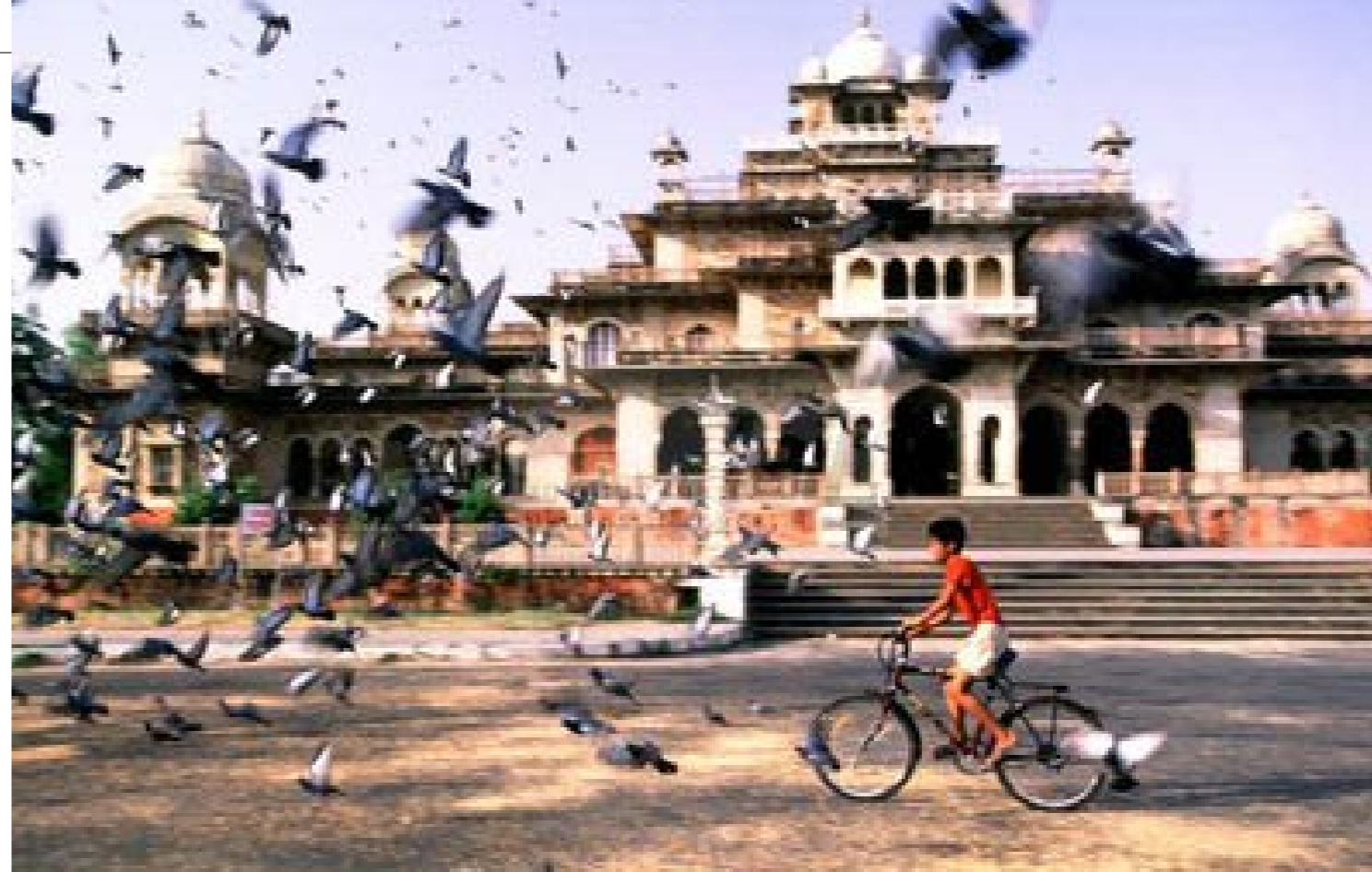
Jaipur es llamada la ciudad rosa desde que el marajá Ram Singh II la mandó pintar de ese color ante la visita del príncipe de Gales en 1876.

No cabe duda de que uno de los principales placeres de Rajastán es recalar en el lujo de los llamados hoteles heritage (palacios, pabellones de caza o fuertes medievales), que no sólo permiten imaginarse protagonistas de un relato de Las mil y una noches , sino también por la posibilidad de disfrutar de maravillosos paisajes y, por