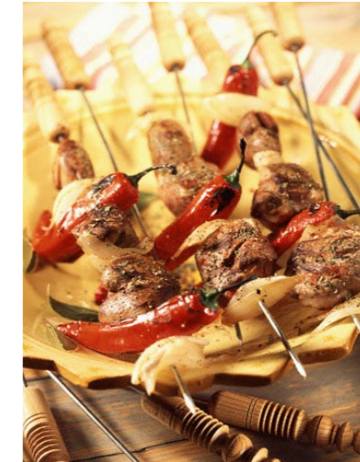
A la izquierda, el Palacio Real de Jaipur. Arriba, el 'sulo', una brocheta de carne marinada en especias de influencia mogol.

su proverbial hospitalidad, una extensión de su antigua época dorada. El mejor punto de partida para iniciar todo periplo por Rajastán es la ciudad de Jaipur, cuya sola mención es sinónimo de leyenda. La llamada ciudad rosa sigue destilando toda la magia que encandiló a los occidentales en los siglos XIX y XX. Razones no le faltan. El gran tesoro de